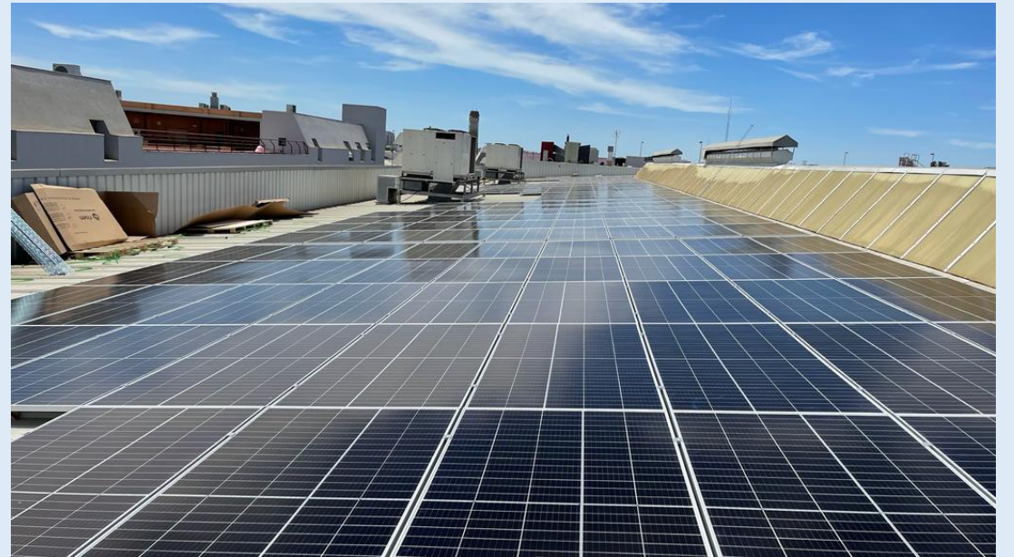
Instalación fotovoltaica de 135,00 kWp en Egondi Artes Gráficas (Sevilla).