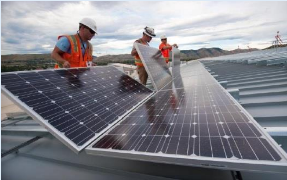
Instalación fotovoltaica de 150,00 kWp en Doñana Fresa (Almonte).