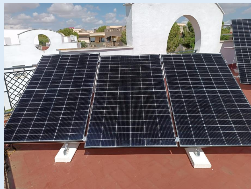
Instalación fotovoltaica colectiva de 13,20 kWp en Ciudad Expo (Mairena del Aljarafe).