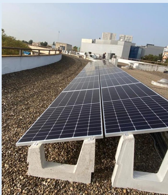
Instalación fotovoltaica de 20,00 kWp en Notaría Luis Barriga (Mairena del Aljarafe).

A continuación, mostramos algunos ejemplos de instalaciones fotovoltaicas de nuestros clientes: